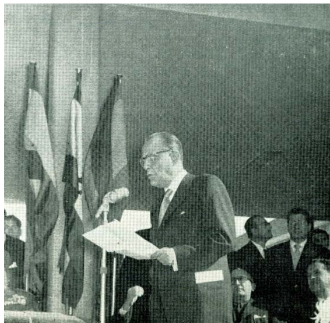
Como rector de la Universidad Laboral (1956-1958).