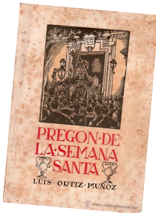
Portada de su Pregón de Semana Santa de 1943.