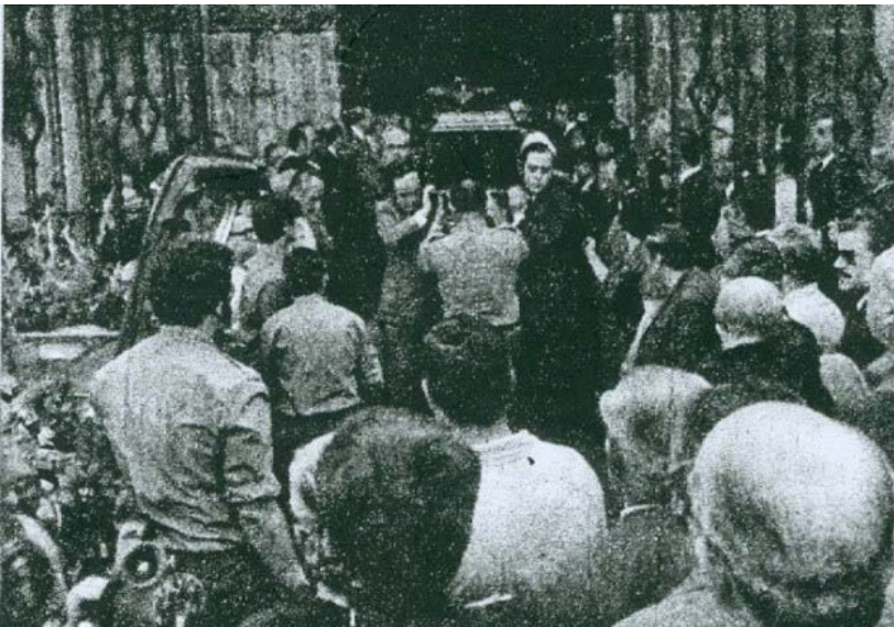
Salida de su féretro de San Juan de la Palma (1975).

el aunar esfuerzos entre todos acabó por ratificar a la Amargura como una de las más importantes hermandades de Sevilla.